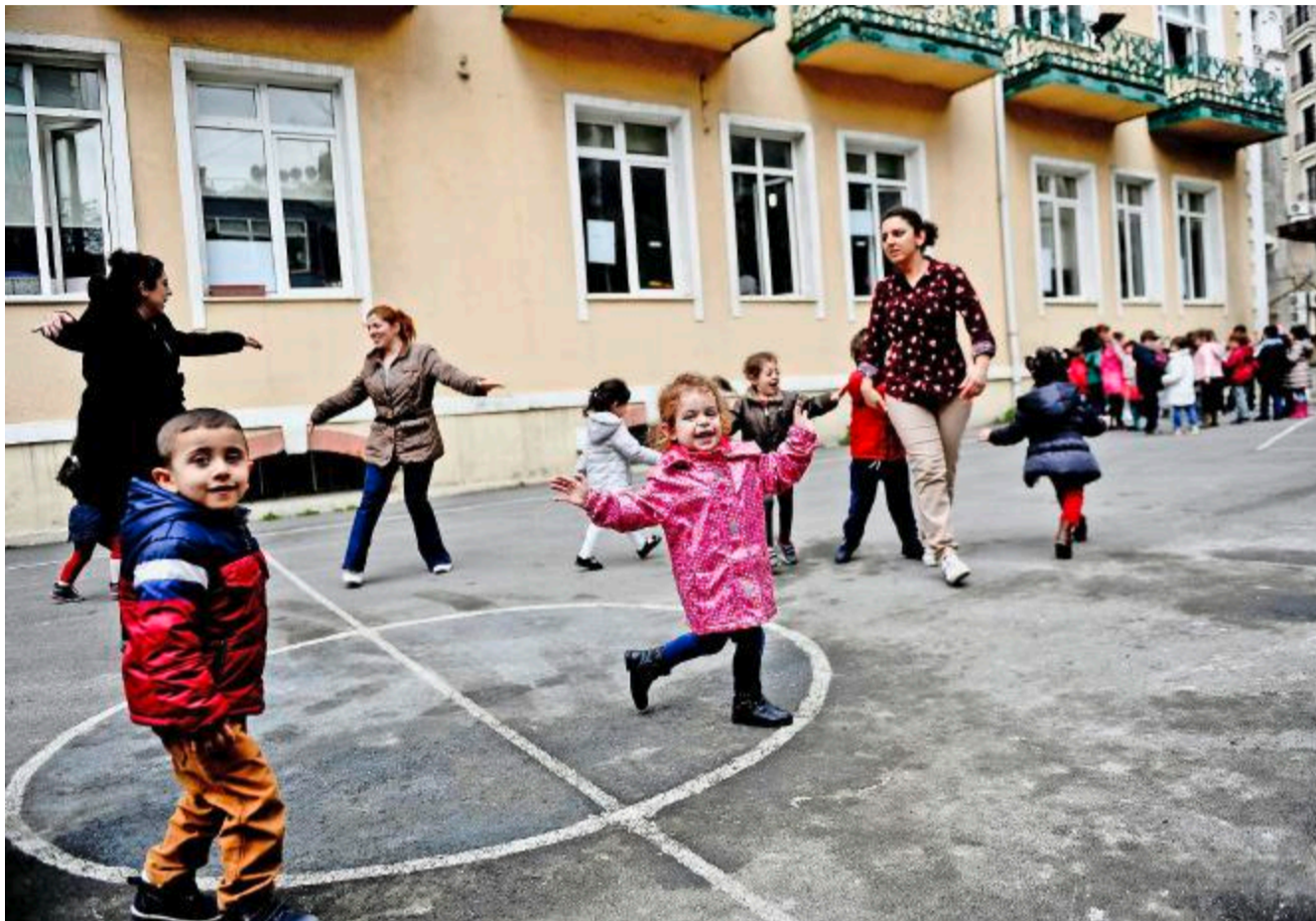
Kinder spielen im Pausenhof einer armenischen Schule in Istanbul.